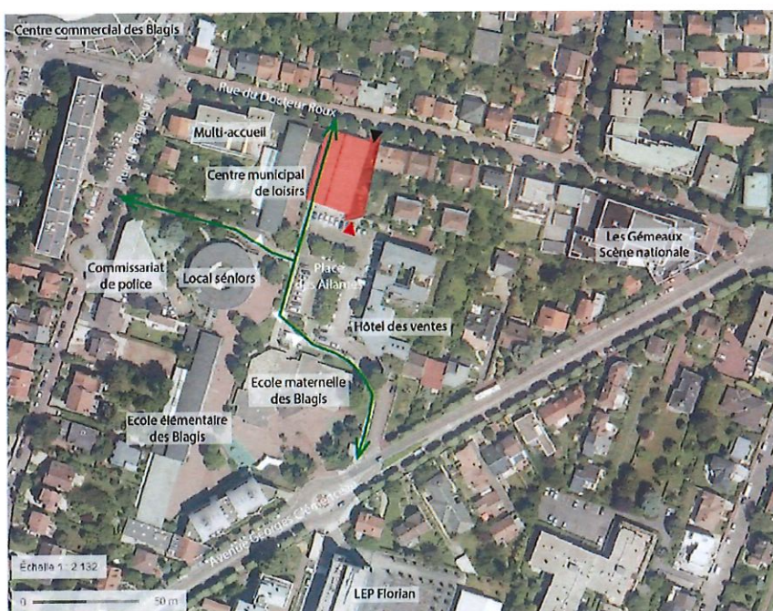
La halle dans son environnement et les flux piétons actuels